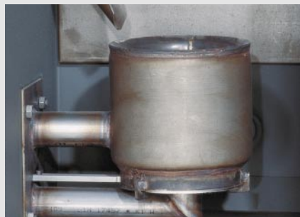
Brennerschale mit automatischer Entaschung (Vitolig 300)