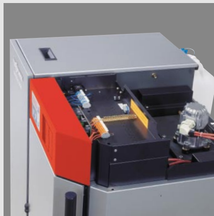
Übersichtlicher Anschlussraum für einfache und schnelle Montage (Vitolig 300)

Das Spitzengerät, der Holzpellets-Kessel Vitolig 300 unterscheidet sich in puncto Heizkomfort und Bedienungsfreundlichkeit nicht mehr von Öl-/Gas-Heizsystemen – dank modulierender Leistungsanpassung, digitalen Regelungen und modularem Aufbau. Die Pelletsbeschickung und die Zündung durch ein Heißluftgebläse erfolgen vollautomatisch, die Heizflächen werden selbsttätig gereinigt. Beste Verbrennungsergebnisse sorgen für extrem geringen Ascheanfall.